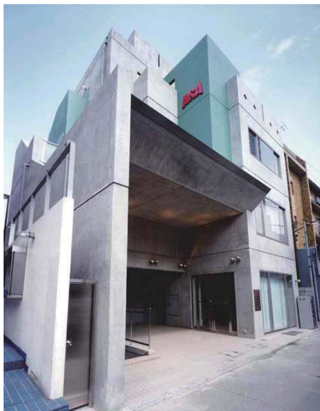
ASA 用賀 2 階：用賀駅北口徒歩 1 分カルディ隣 〒158-0097 世田谷区用賀 4-11-14