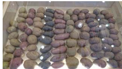
圧巻！北海道の10種のジャガイモ