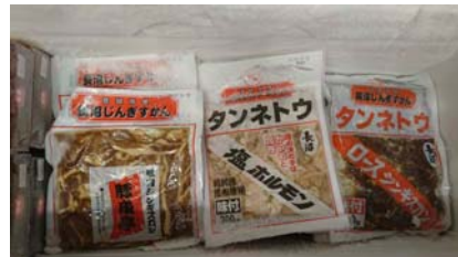
味は最高！ジンギスカンとホルモン