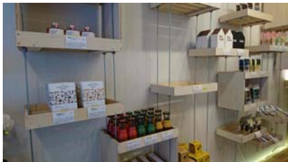
商品の陳列にもこだわりが