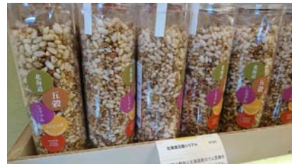
カラフルな北海道の五穀シリアル