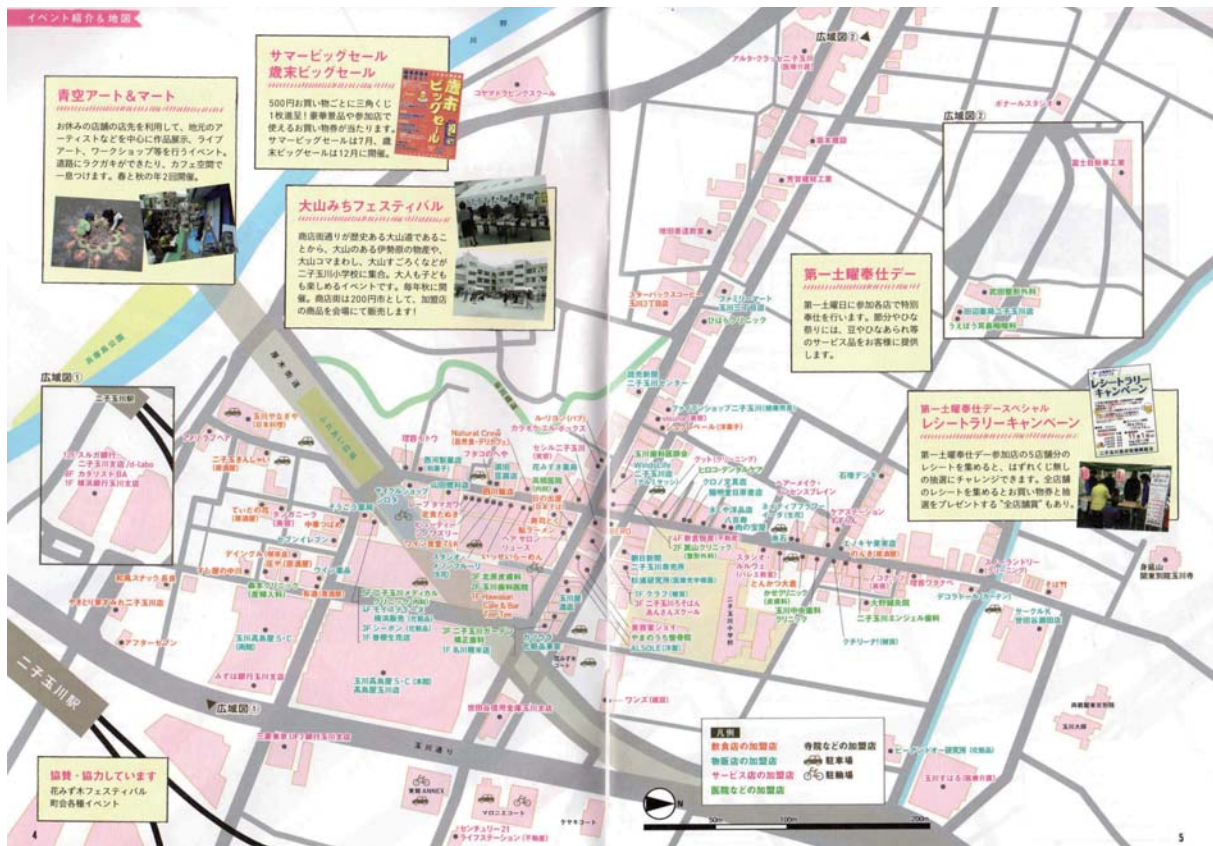
二子玉川商店街ガイドブックより