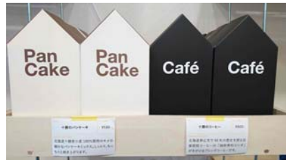
スタッフが厳選した商品が並びます