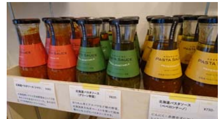
瓶がカワイイ北海道パスタソース