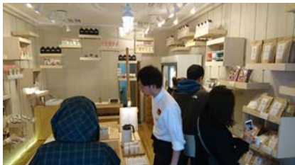
清潔感溢れるおしゃれな店内