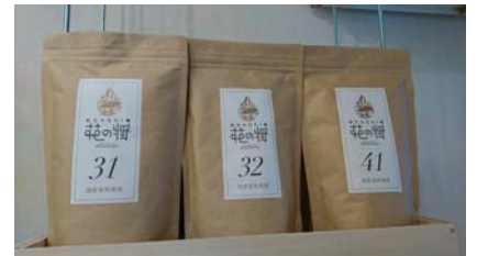
番号で配合が異なる出汁パック