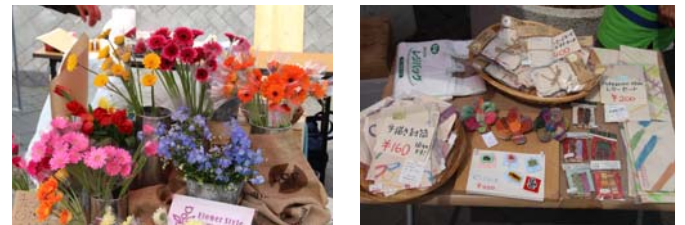
花や小物、洋服など物販のお店も！