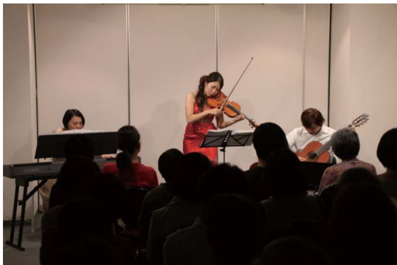
熱演するアंक・ミューズのみなさん

公益社団法人玉川法人会第9支部が主催した「大規模災害復興支援コンサート」が10月15日(土)にASA用賀2階多目的ホールで開催されました。当日は好天にも恵まれ多数の方が秋の1日、素晴らしいクラシックコンサートに魅了されました。特に今回はクラシックギターの演奏が入り今までとはひと味違うプログラムとなりました。演奏曲目も馴染みのある曲ばかりで「あの曲を生で聞けるなんて!」というお言葉をいただきました。個人的にはギターの名曲「アルハンブラ宮殿の思い出」と「ツィゴイネルワイゼン」に大感激!「アルハンブラ宮殿の思い出」は、どうやって弾いているのだろう?という長年の疑問が解けました。今後も玉川法人会では様々な企画をご用意しておりますので是非ご参加ください。