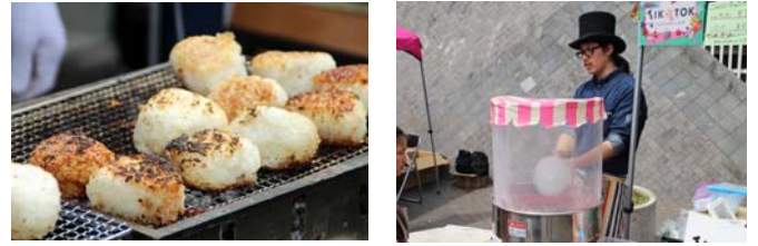
大人も子供も楽しめるメニューもありました！