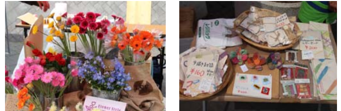
花や小物、洋服など物販のお店も！