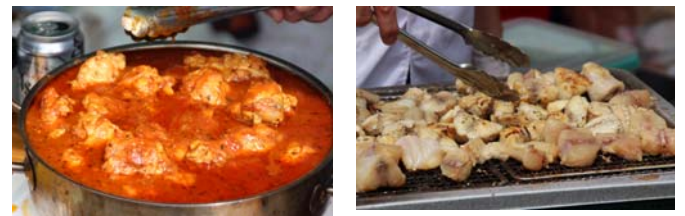
各店自慢の料理で勝負！安くて旨い！