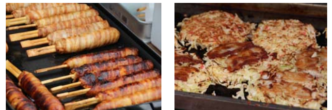
お腹も心も大満足間違い無し！