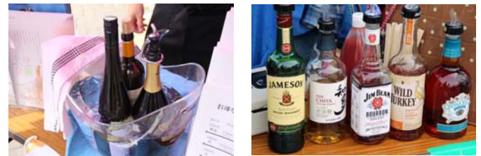
ワインにスパークリング、バーボン、飲み物も充実！