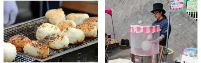
大人も子供も楽しめるメニューもありました！