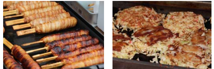
お腹も心も大満足間違い無し！