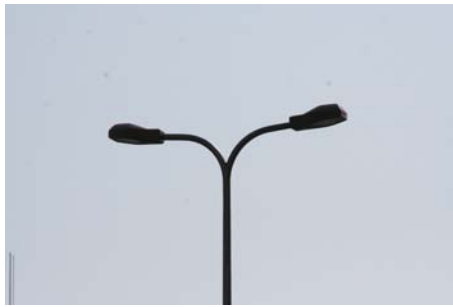
瀬田の交差点の街路灯