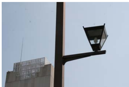
国道246号沿いの街路灯。ガス灯を彷彿とさせる優しい灯りです。