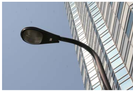
用賀のバス通りの街路灯