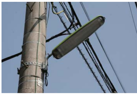
毎度お馴染み電柱の街路灯