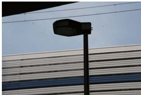
エフエム世田谷のスタジオ前の街路灯

今回取材してみて改めて街路灯の種類の多さにビックリしました。区、都、国と道路を管轄する自治体毎に街路灯を設置管理しているので場所によっては、商店街、区、都の街路灯が隣接しているというところもありました。道路が明るくなることは犯罪の抑止力にもなるのでそれはそれで良しと考えたいものです。しかし、写真でもお分かりのとおり街に張り巡らされた電線、なんとかならないですかねえ。