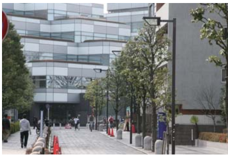
用賀駅からいらか道に沿って立っている美しいデザインの街路灯