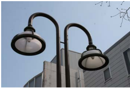
二子玉川玉電線路跡遊歩道の街路灯。通りにマッチしたデザインです。