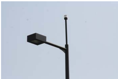
多摩堤通り沿いの街路灯