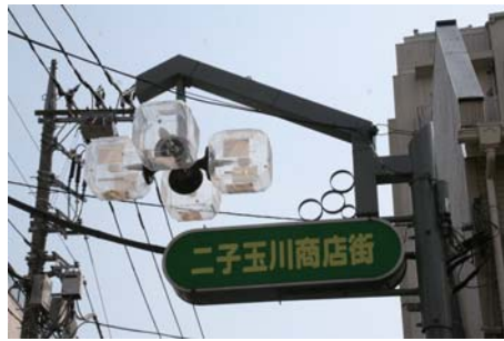
商店街の入口を示す街路灯