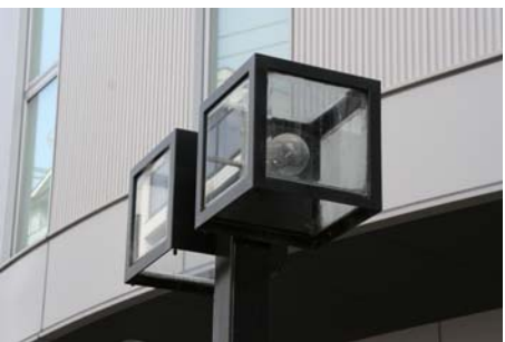
高島屋本館北側バス通り沿いの街路灯。意匠を凝らした素敵なデザイン