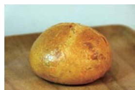
カンパーニュトマト