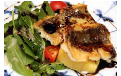
身が大きい島根産穴子のソテー