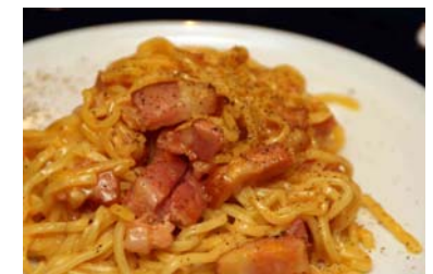
生クリームを使わないローマ風カルボナーラ