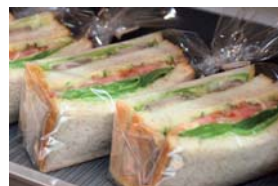
ハムも自家製です