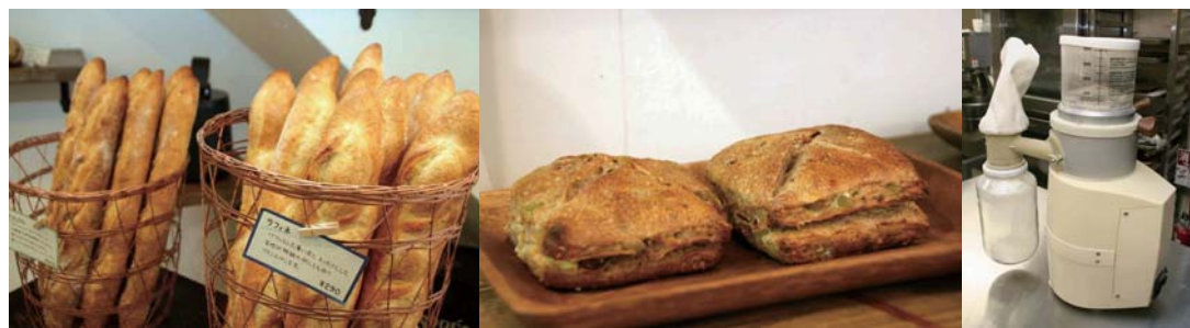
「万さく」さんの奥です 外はカリカリ中はふっくら 大人気キウイ&クリームチーズ 石臼製粉機

自家製酵母を使っている DELTA さん。最大の特徴は店内の石臼製粉機で小麦粒(玄麦)をはじめ、キビ・アワ・玄米などの雑穀を自家製粉し、それらを混ぜ合わせて様々な生地を作ることができるということ。また、パン、サンドイッチの具材もすべて手作りという徹底ぶり。このこだわりに魅せられたファンは多い。