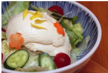
これだ！特製用賀豆腐サラダ