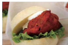
タンドリーチキン