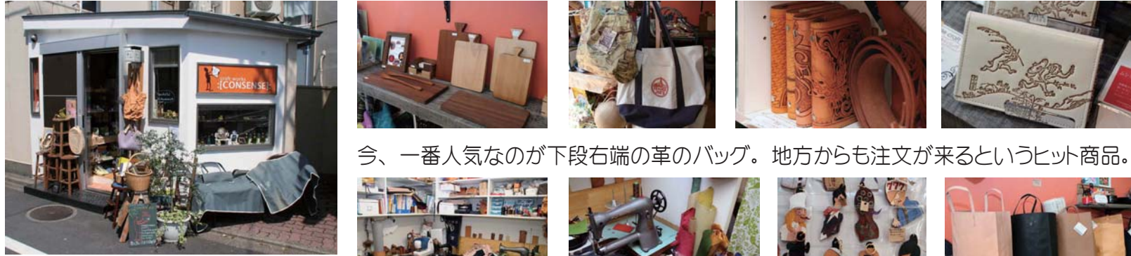
用賀の京西小学校近くのマンショングリーンハウスの1階にあります

「ハンドメイドクラフトと『革り小物』 気まぐれ雑貨のお店」をコンセプトに掲げ、異なるジャンルの作家の作品を販売するコンセンスさんには楽しみがいっぱい。ついつい長居してしまいます。革製品のオーダーメイドからリペアまで革に関することに何でも応えてくれます。