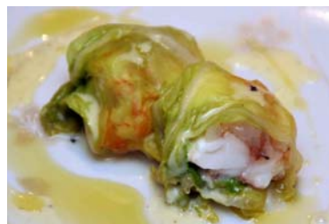
石鯛と海老のキャベツ包み