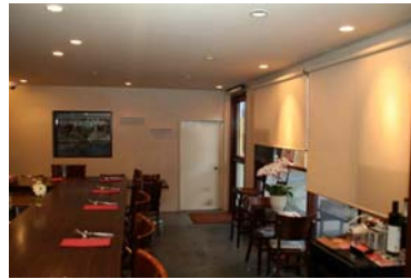
席数は20席。予約した方が無難

天使の翼を意味する「aletta」さんは、毎日築地より仕入れる新鮮な鮮魚、京都と神奈川の契約農家より直送の色鮮やかな野菜、厳選した肉類を使って季節の食材の味わいを最大限に活かす和やフレンチ等の技法も用いたイタリア料理店。自家製の手打ちパスタも常時5、6種類用意。グラスワインの豊富さも嬉しい気さくなお店です。