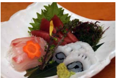
人気のお造り三種盛り合わせ