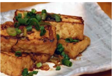
絶品！厚揚げステーキ