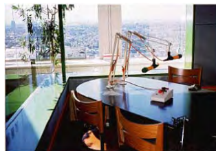
<スタジオキャロット>

平日午後の放送は三軒茶屋スカイキャロット26階のスタジオキャロットからの生放送。日替わりで「あの歌手」に逢えます。現在のパーソナリティーは以下の通り。アラフィフには懐かしい名前が並びます。素晴らしい景色を眺めながら目の前の生放送を聴く。こんな贅沢があつていいのでしょうか?ぜひ一度、スカイキャロット26階へ行ってみてください。至福の時間が味わえます。